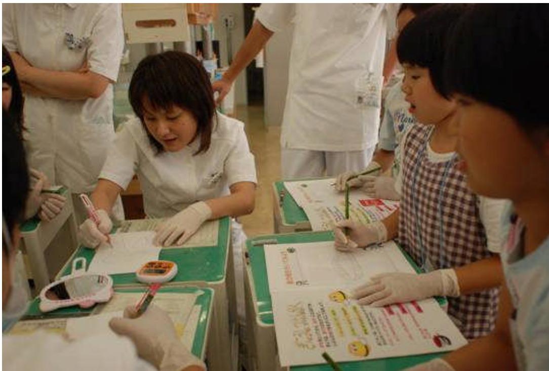
7月4日：夏休み子供歯の保健教室