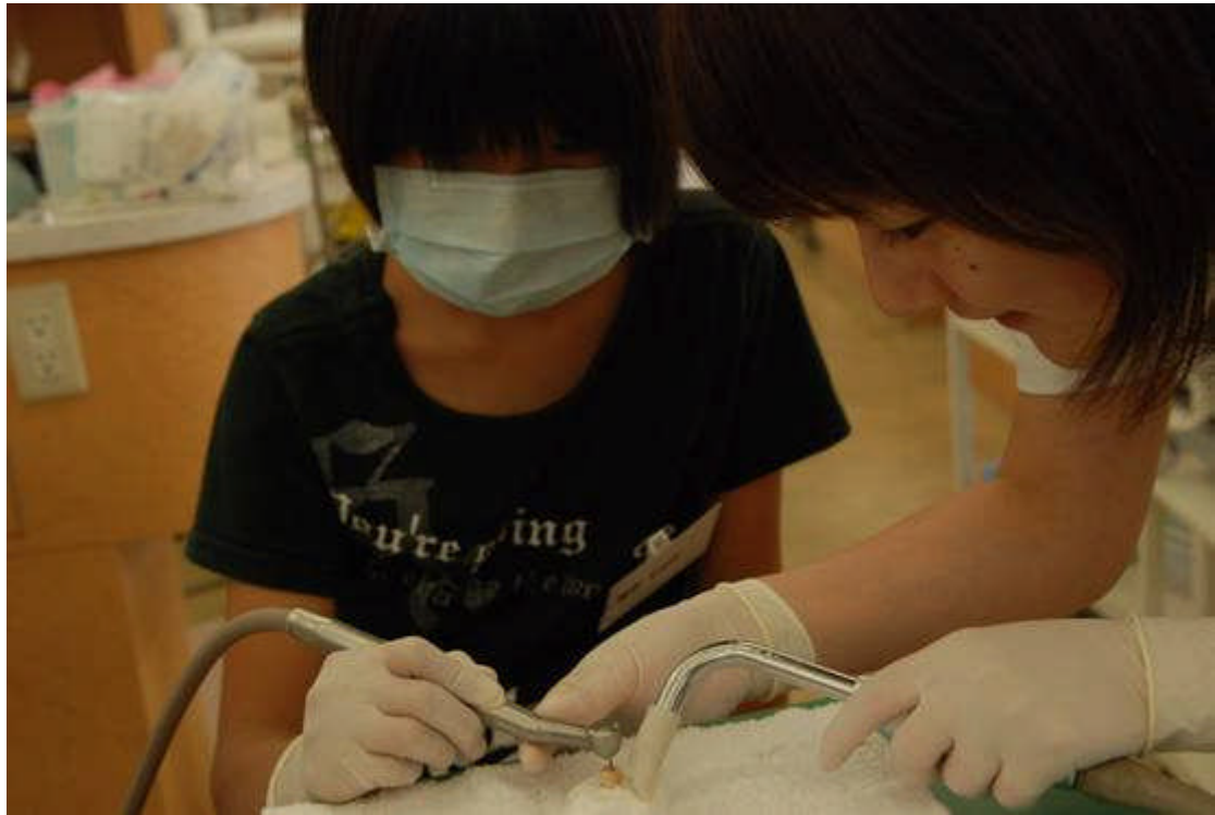
7月4日：夏休み子供歯の保健教室