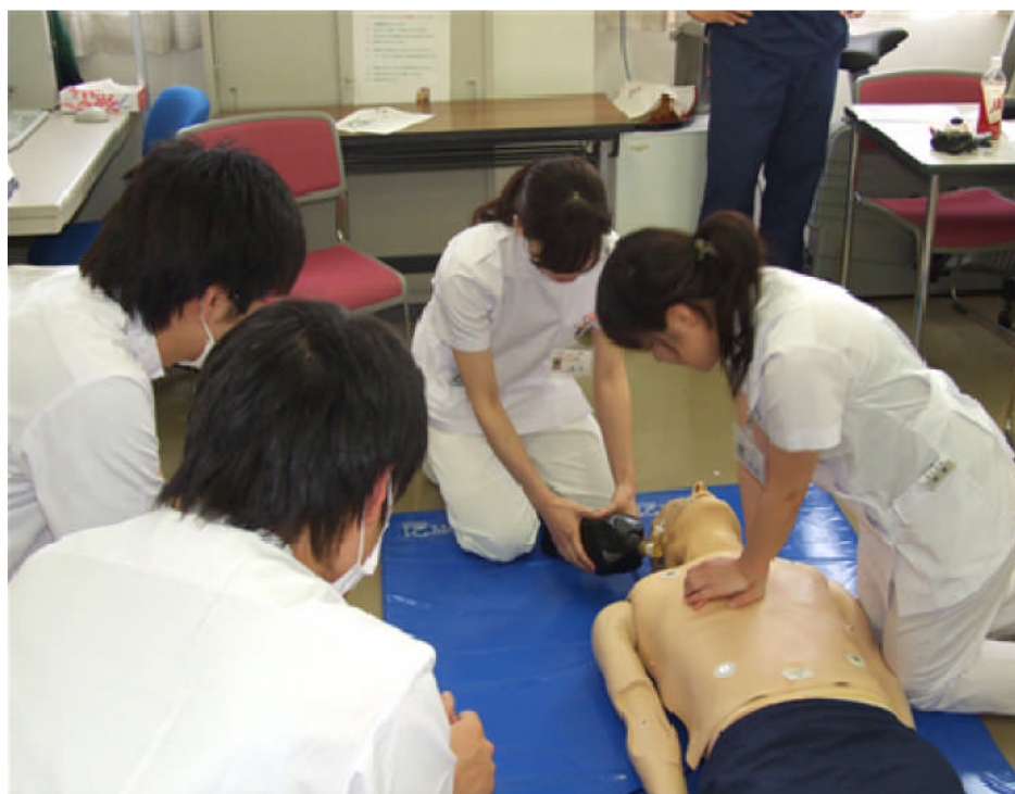
単独型研修医の高度救命救急研修（医科研修医と合同）