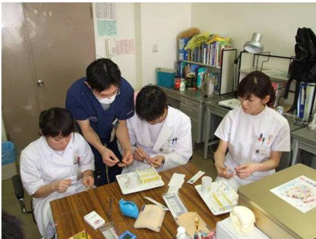
単独型研修医の一般外科研修（医科研修医と合同）