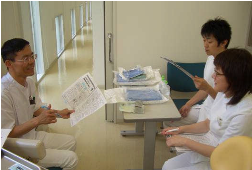
各歯科医師から専門分野の講義を受ける。