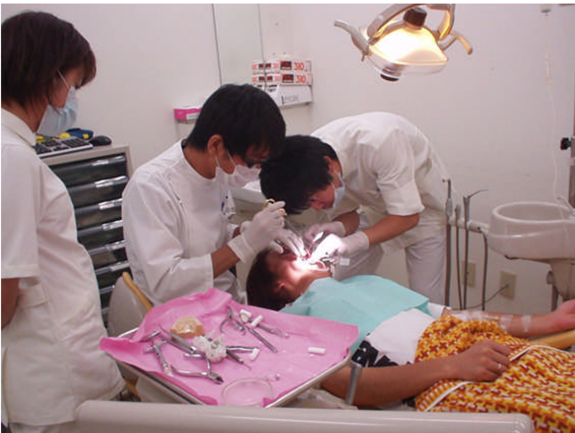
下顎骨骨折非観血的整復術。静脈内鎮静法を併用しながら指導医とともに行う。