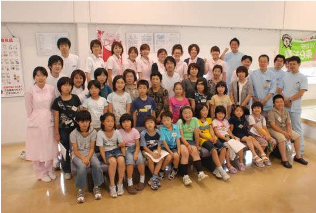
7月4日：夏休み子供歯の保健教室