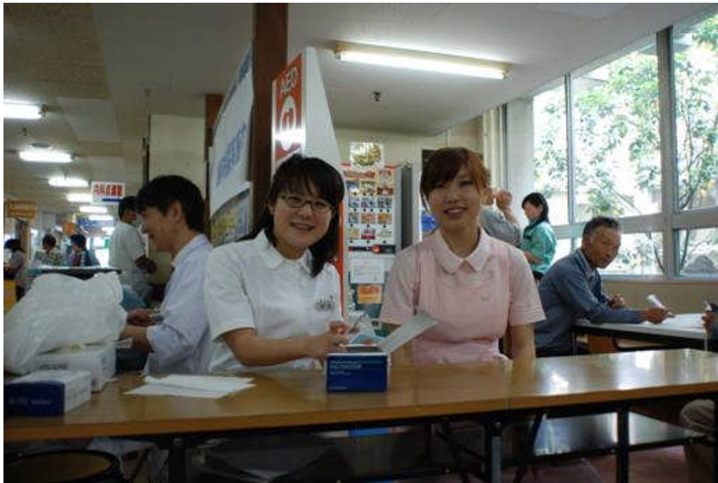
6月3・4日 歯の衛生週間：病院玄関にて歯科相談、歯科健康チェックと検診を行う。