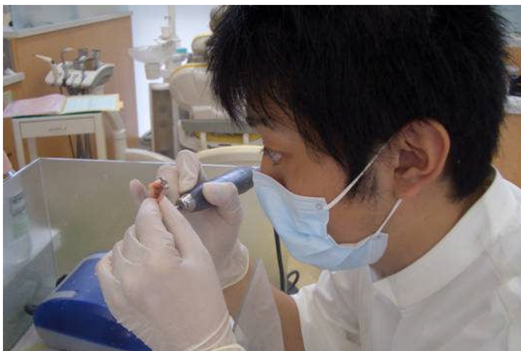
真剣に研修に取り組む研修医