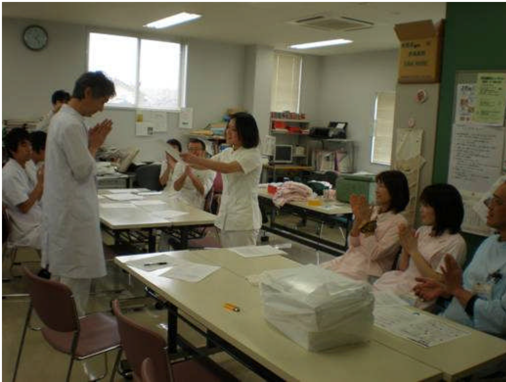
3月31日（水）研修終了証書授与式