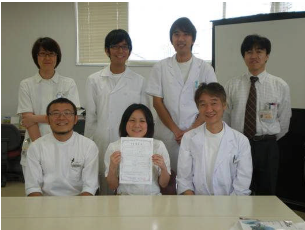
3月31日（水）研修終了証書授与式