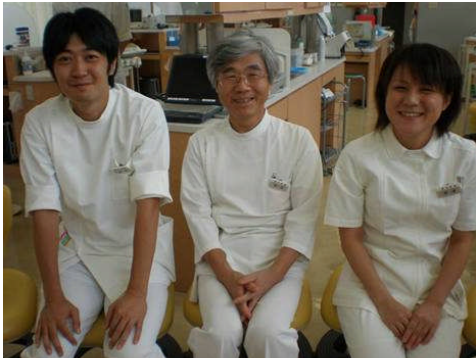
原田所長（中央）と単独型研修医（右）、協力型研修医（左）