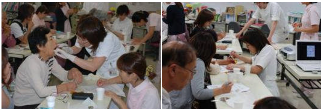
6月24日：歯の保健大学