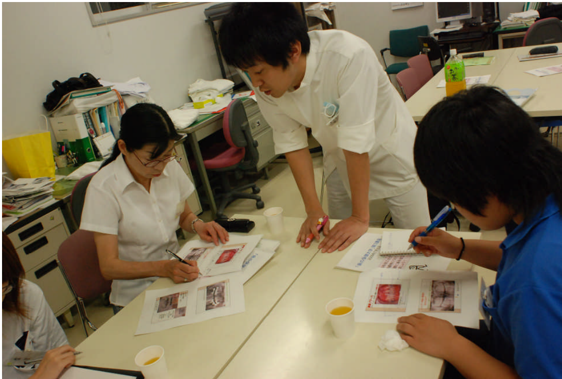
7月8日：歯の保健大学