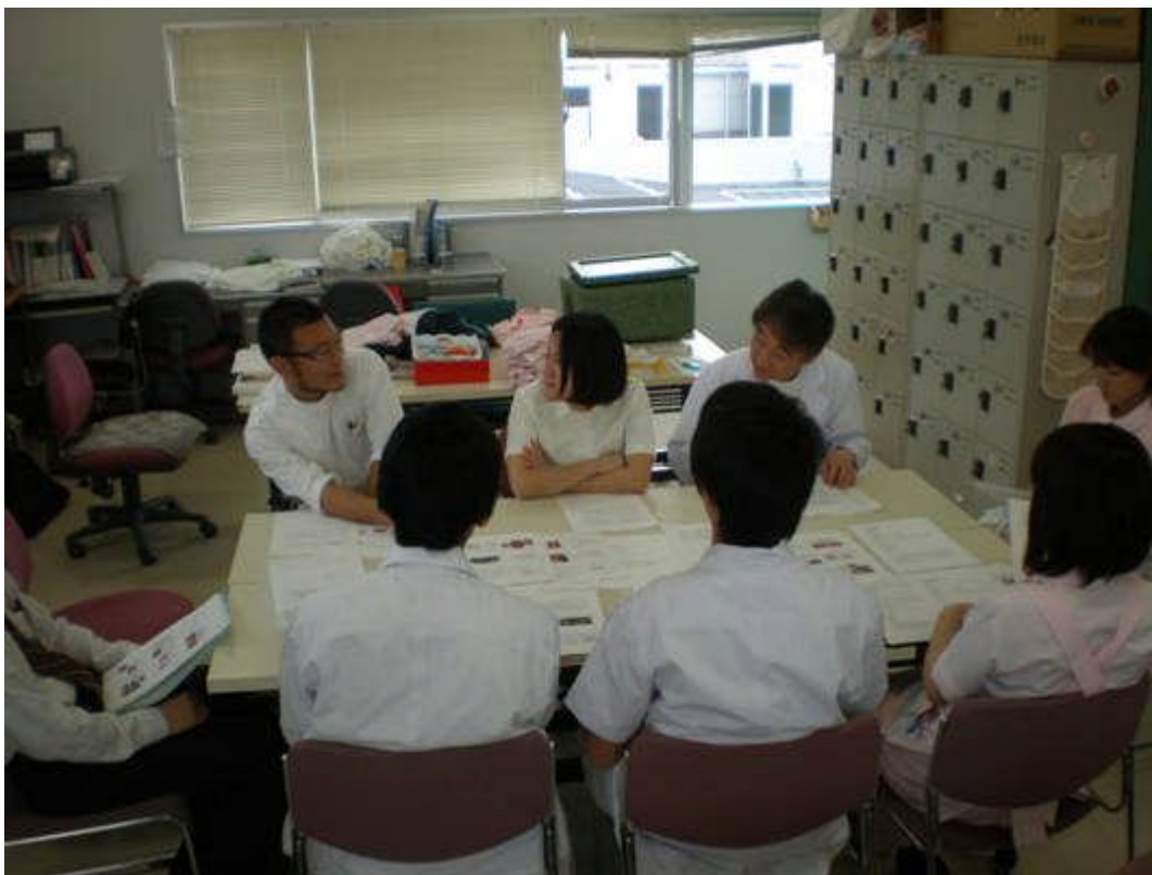
指導医、プログラム責任者、事務長、歯科衛生士、歯科技工士が同席しての 研修委員会（1回/月）。