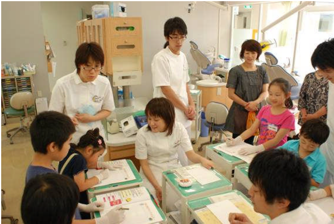
7月4日：夏休み子供歯の保健教室