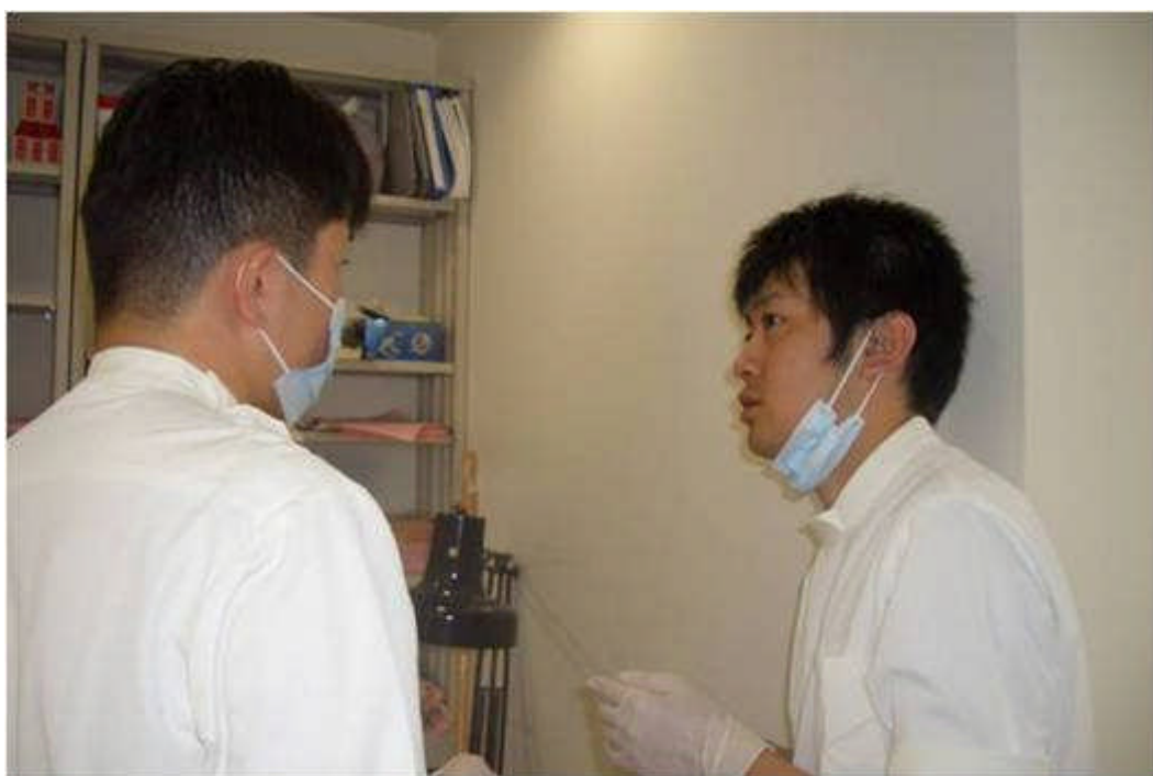
診療室の後ろで指導医から治療中の助言を受ける。