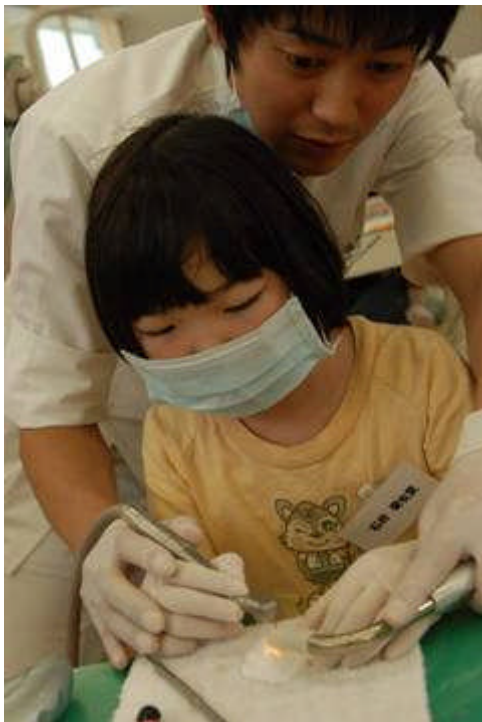
7月4日：夏休み子供歯の保健教室