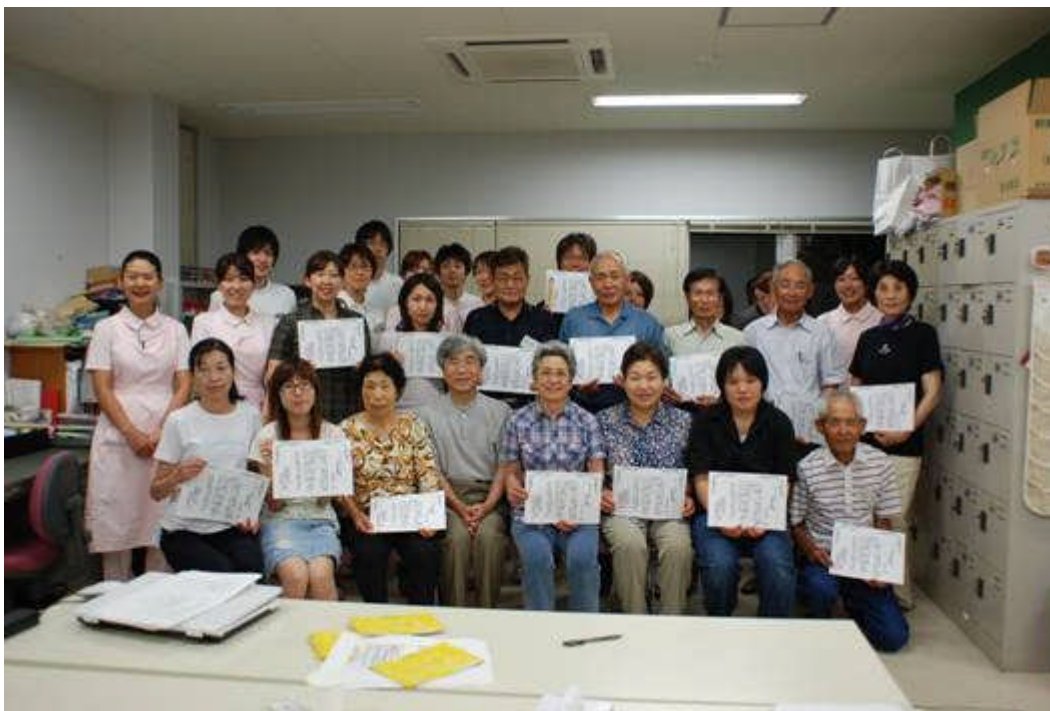
7月15日：歯の保健大学卒業式