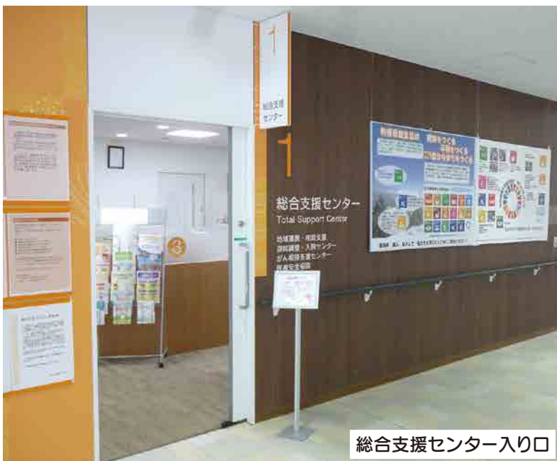
総合支援センター入り口