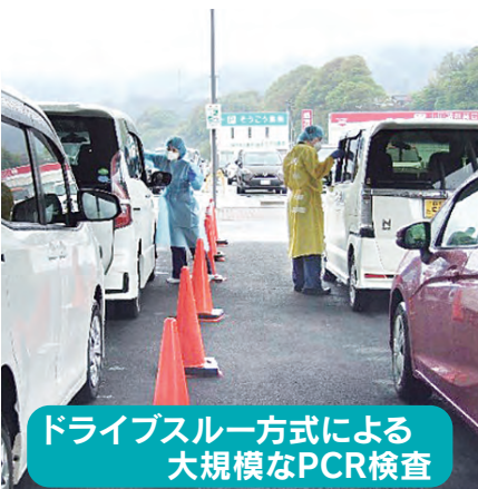
ドライブスルー方式による大規模なPCR検査