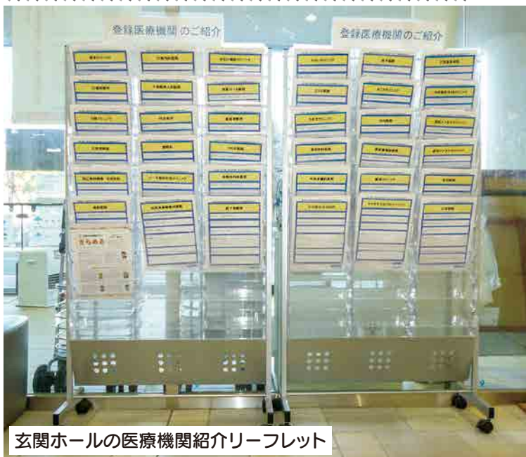
玄関ホールの医療機関紹介リーフレット