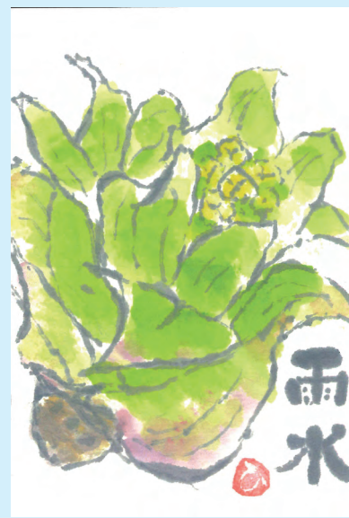
絵手紙 沼田市栄町 宮野入 博子