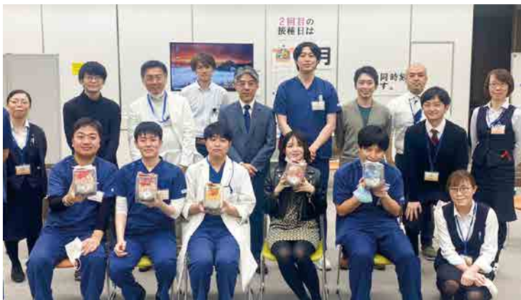
撮影時のみマスクを外しています

3月5日(土)、2021年 度群馬県民連臨床研修報告会 がオンラインで開催されまし た。臨床研修報告会は、群馬 県民連に所属する研修医(初 期研修医・専攻医・他)が、 1年間の研修で得た学び・知 識を指導医やメディカルスタ ッフと共有すること を目的として開催し ております。『私を 成長させてくれた事 例』を演題テーマと して、経験した症例 や事例を通して学ん だことや実感したこ と、今後の自分の医 師像や医療観などそ れぞれの思いについ ても話されました。