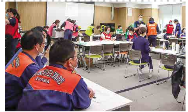
病院災害対策本部に集合して 各関係機関とで避難先の調整を訓練

2017年の水防法改正により、洪水浸水想定区域の指定対象はすべての河川流域に拡大されました。 利根中央病院に隣接する片品川上流には蘆原ダムがあり、ダム上流で豪雨が発生した場合、 2026年3月7日、これまで複数回の訓練を重ねており、2026年3月7日に4回目となる病院避難訓練を実施しました。訓練では本部設置から始まり、転院先医療機 院では病院避難計画の整備を進めています。 この訓練で得られた課題を今後の計画に反映し、関係機関との連携を深めながら、災害時にも安全に対応できる体制づくりを進めていきたいと考えています。