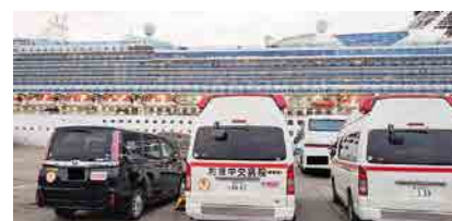
2020年 ダイヤモンドプリンセス号対応