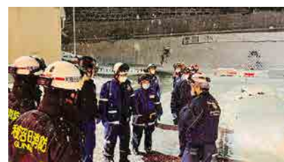
2025年 関越道多重事故対応