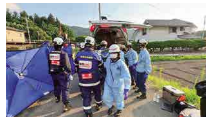
2025年 白沢発電所事故対応