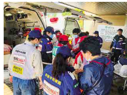
2019年 長野県台風19号被害対応