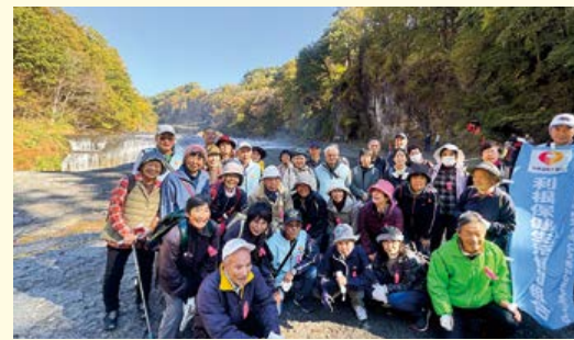
↑すこしおを意識した減塩のお土産

散策前には、リハビリ室の諸田技士長から準備体操レクチャーもあり、ケガもなくみんなで楽しく散策することができました。