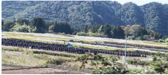
山積みされている行き場のない黒い袋(フレコンバッグ)

高速道路から見た街並みは、放射線の影響で耕作放棄された水田に太陽光発電設備が設置されており、津波で消えた浪江町の住宅街には雑草が生い茂っていました。