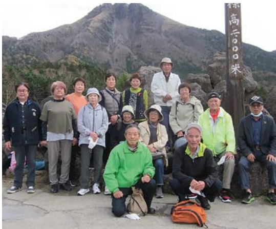
東部ブロック交流会 片品丸沼高原散策