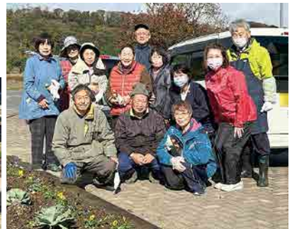
利根中央病院の花壇を整理