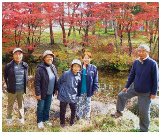
昭城南支部 赤城久呂保高原別荘地ハイキング

〒378-0053 沼田市東原新町1861番地1 ☎0278(22)6060 FAX(22)6262 利根中央病院 沼田市沼須町 ☎(22)4321 片品診療所 片品村鎌田 ☎(58)3910 利根中央診療所 沼田市西原新町 ☎(24)1202 利根歯科診療所 沼田市高橋場町 ☎(24)9418 生協みなかみ歯科 みなかみ町後閑 ☎(25)3399 介護老人保健施設とね 沼田市東原新町 ☎(22)8855 サニーホームひまわり 沼田市高橋場町 ☎(22)3223