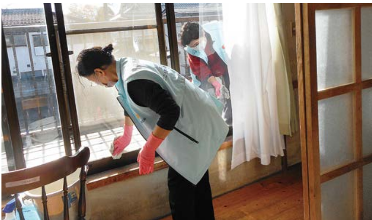
沼田東支部 助け合い活動 (ガラス清掃)

組合員になって 利用 組合員になるためには、定款地域がきまっています。沼田市、利根郡、吾妻郡一円、旧赤城村、旧子持村に在住、又は事業所に勤めている方が対象となります。組合員になるには「加入申込書」に出資金を添えて、病院、診療所、生協本部総務部へお申し込み