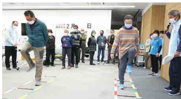
作成したラダーを使いさっそく実践!