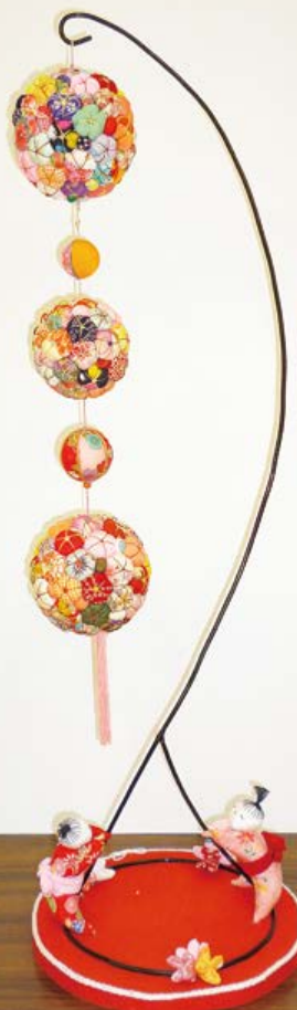
「吊るし雛」 沼田市白沢町 組合員

〒378-0053 沼田市東原新町一八六一の一 利根保健生協「なかまの作品係」 メール投稿 nakama@tonehoken.or.jp