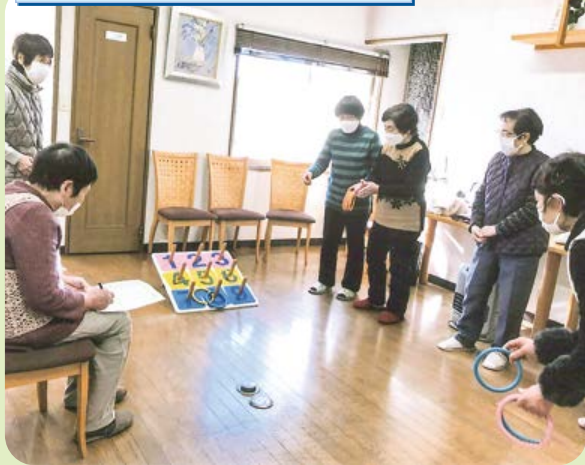
沼田北支部 ときめき班

毎回タオルで作ったダンベルを両手に持ち体操しています。今回は握力チェックも行い、日頃の体操している成果がみられました。輪投げゲームも2チームに分かれて楽しくできました。