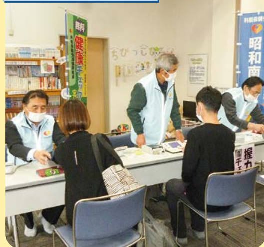
昭和東・昭和南支部

偶数月の土曜日の午後に、昭和の湯で昭和東・南支部合同で継続して行っています。前回から血管年齢測定も始めています。幅広い年齢の方が興味をもって参加してくれました。