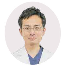
利根中央病院 泌尿器科 科長