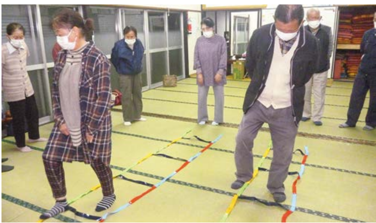
碓田白岩合同班会 (4色あしびみラダー)

組合員の代表が各事業所の 利用委員会へ参加し、より利 用しやすい活動、運営に 関して意見交換を定期的に行 っています。 地域では、23ある支部を中心に組合員による自主的な活動をしています。まちかどでの健康チェックやお互い様の助け合い活動、各班での班会