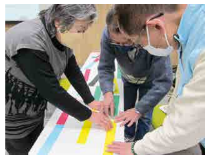
健康づくり委員が講師となりラダーづくり

今回、班会や地域サロンの集まりで広めたいと参加している方も多く、今後が楽しみです。