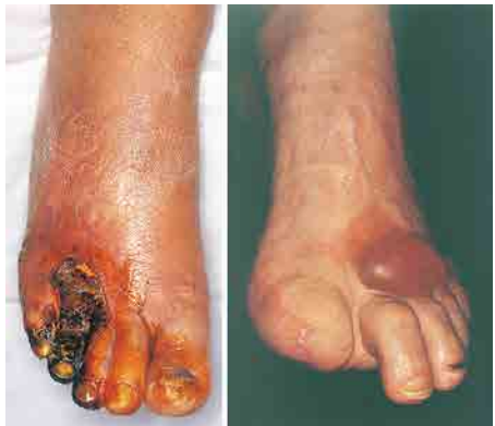
左: 血流障害、神経障害、感染症による足壊疽 右: 入浴洗髪中にお湯の滴下に気づかずできた火傷による水疱(すいほう)