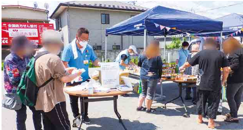
次回のフードドライブ「おすそわけ」 12月18日(土)10時~12時 とね虹の里広場

生協のとくもう 目標1・2を紹介しました。生活困難者への無料低額診療事業や2020年12月から始まったフードドライブがあります。また、班会やサークル活動では