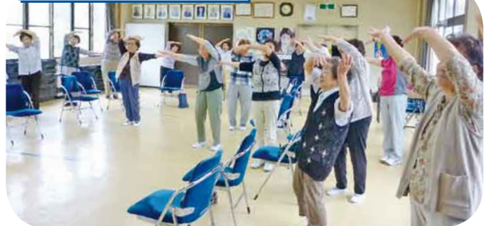
熱中症について/ころばん・きよしのずんどこ体操 熱中症の予防と対策を学び、体操を楽しみました