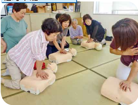
AED講習 人形を使って心肺蘇生のやり方を学びました