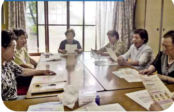
お口の健康について/あいうべ体操 歯周病の予防に、体操で舌の筋肉を鍛えました