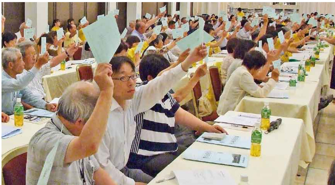
第38回通常総代会 全議案を採択