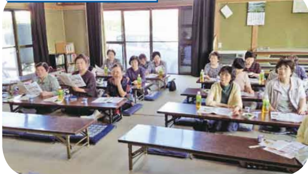
大腸がん・足指力チェック 足指機能向上にストレッチやケア方法を学びました