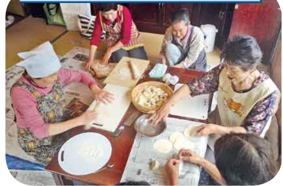
ぎょうじ作り 皮から手作りのおいしい 焼きぎょうじができました