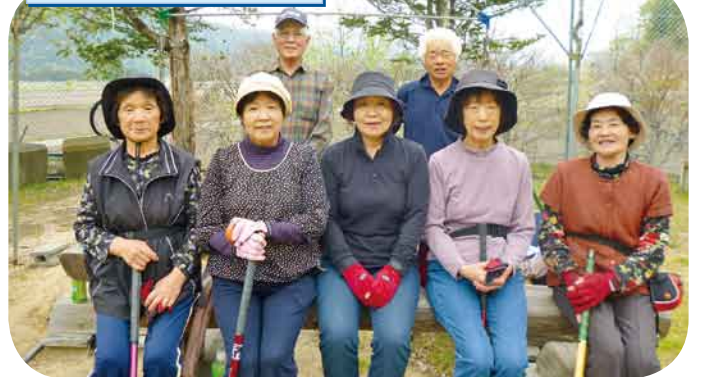
グラウンドゴルフ/骨密度チェック 試合に向けて、練習に打ち込みました