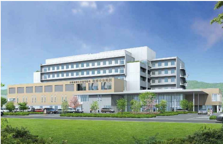
新病院完成イメージ