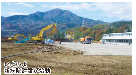
いよいよ新病院建設が始動

計画を確実に成功させるためには厳密な計画執行が必要です。「4人の医師」をはじめとした人材の確保、通院手段等かかるといえる条件整備、出資金「7億円増資」による資金確保は引き続き課題です。従来の増資方法に加え、金融機関(利根郡信用金庫・利根沼田農協・群馬銀行)の自動振替口座を利用して「積立増資」や新病院建設用地代を出資金でまかなう「一坪増資運動」(一坪4万円)も随時受け付けております。「安心して住み続けられるまちづくり」に向け、ぜひご協力をお願いいたします。