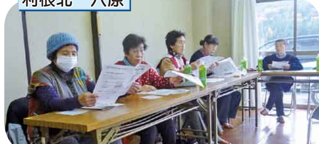
みそ汁塩分チェック・骨密度測定 適切な塩分量を学び、食生活を見直す機会になりました。