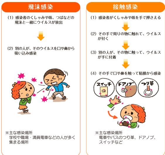
表1：飛沫感染と接触感染

インフルエンザは急激に発症し、発熱、頭痛、関節痛などを伴います。流行の時期は1月～2月がピークで4月まで散発的に続きます。そしてインフルエンザは、ウイルスが体内に侵入し、どや気管支、肺などで増殖、1～3日で発症します。インフルエンザウイルスには大きくA、B、Cの3つの型に分けられ、世界的に流行を繰り返すことにより変異株がでてきます。地球規模の動向を解析して流行の予測が行われ、その年のワクチンに活かされています。インフルエンザは感染力が強く、日本では毎年約一千万人、およそ10人に1人が感染しています。インフルエンザにかかっても、軽症で回復する人もいますが、高齢者や幼児では肺炎や脳症などを併発して重症化