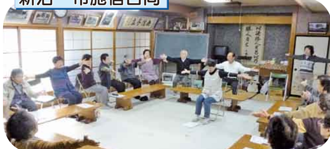
あいうべ体操・口福カルタ/義歯の話 体操やカルタで楽しく盛り上がりました。