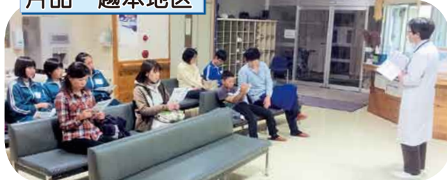
インフルエンザ班会 予防接種と学習で健康管理の意識が高まりました。