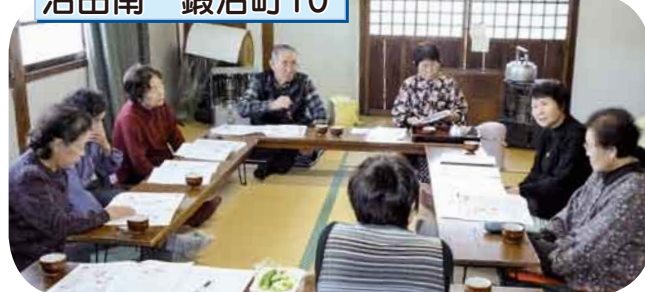
大腸がんチェック・糖尿病の話 生活習慣病の予防に、効果的な食事・運動を学びました。