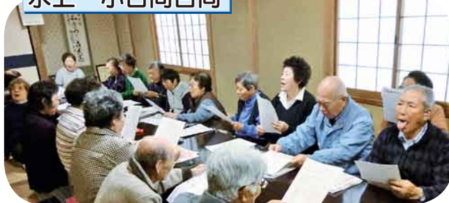
体組成・足指力チェック/あいうべ体操 病気予防に、お口の体操で免疫力を高めました。