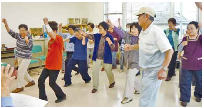
「組合員ホールにぎわい」で体操班会 (沼田東支部)

「交流の機会 うれしい」 「生協の情報地域へ」と昨年度、『利根の保健』が配布されていない地域の配達者さんを13人増やした沼田西支部。今年も配達に協力してもらっている方へのねぎらいと交流を目的に、7月16日(火)、『配達者へ「苦労さん会」を「スパリゾートゆにーいく」で開催し16人が参加しました。 参加者は血圧・体組成・血管年齢チェックで健康状態を確認したあと、目前に控えた新病院建設の進捗状況などについて、布施新病院建設事務局長より話がされました。 その後は昼食をとりながらの座談会。「組合員のためによりよい病院をせひ」「こういった交流の機会があつてうれし