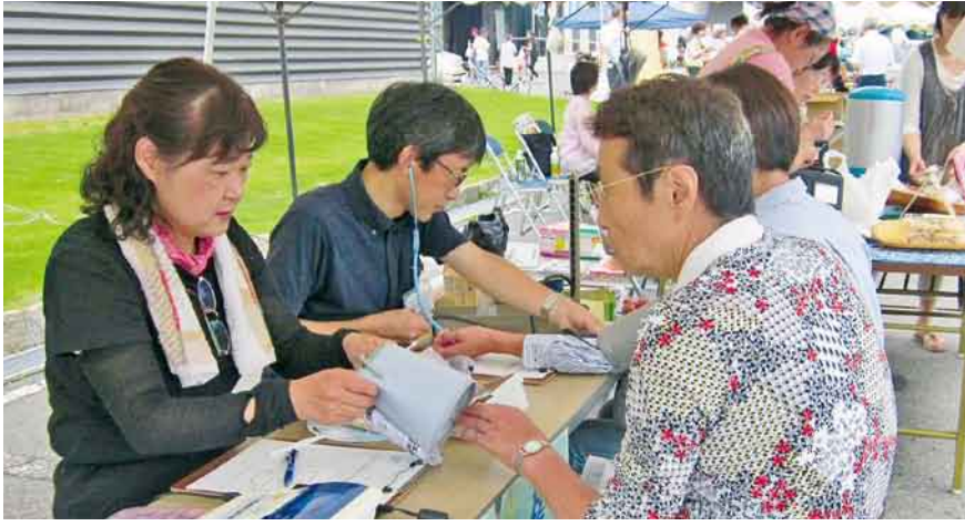
まちかど健康チェック ▲片品支部 ▼月夜野東支部

新病院建設に着手する今年度、最初の節目となった6～7月の『支部づくり・班づくり・班会開催月間』では、各地域で多彩なテーマの班会をはじめ、支部主催の企画が展開され、健康づくりやふれあいの輪が広がっています。