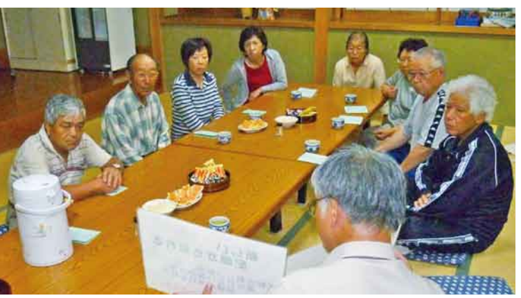
初班会で認知症予防の話 (片品支部土出伊閑班)

あぜ道 六月号の医療相談 室はカラー印刷となり「あいうべ体操」を載せたら好評だった。新聞見たよ、運転しながらやっていると患者さんから声をかけられた。わかりやすくすぐ実践できる、これがポイントだ。いろいろな健康体操はあるが、なかなか覚えられなかつたり、道具が必要だったりするがそんな心配はいらない ▼医療福祉生協連でも全国的に口の健康と認知症予防を絡めて「あいうべ体操」を宣伝し実践するように呼びかけている。しっかりと噛むことは脳の刺激が高まり、認知症を予防することが研究されてわかってきている。認知症患者は現在全国で四百万人を超えており、今後の高齢化の中でますます増えるといわれている。 医療福祉生協の健康づくり運動の中で、いつでも簡単にできて体に良いことを実践したいものである▼「あいうべ体操」はお金もかからず簡単に実践できる。認知症の予防に力をつけて行くことと同時に、認知症になっても大丈夫な街づくりをしていくのは医療福祉生協がめざすところである▼利根中央病院建設が目の前である。建物を新しくすることは大切だが、組合員の健康を守る砦として健康づくり運動の拠点にしていく必要がある。組合員が気軽に集まり班会を旺盛に開き、簡単にいつでもでき楽しく生き生きと運動を行うことができれば最高だ。「いのちの章典」と医療福祉生協連の理念を心にすえて明日の利根保健生協をつくらう。(中澤)