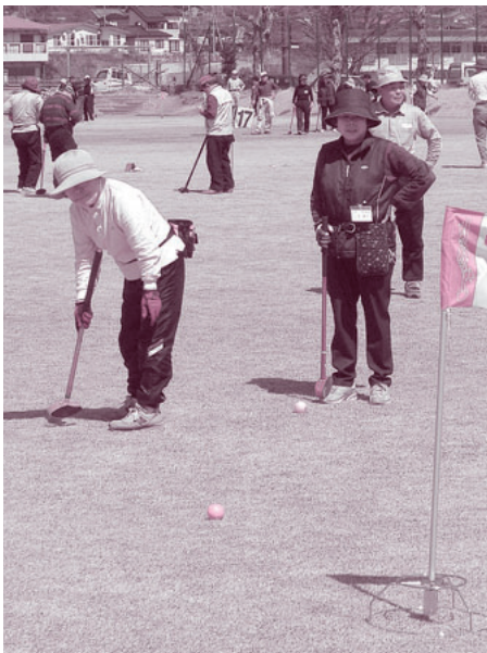
広い会場いっぱいを活用し、熱戦をくり広げる。