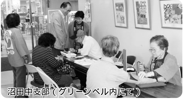
沼田中支部(グリーンベル内にて)

昭和東・南支部(昭和の湯にて) 「WHO世界保健デー」の呼びかけに応え、まちかどで健康チェックにとりくみました。評判の体組成チェックでは「こんな簡単にわかるの?」「内臓脂肪が少なくて良かった」「つまづき易いと思ったら足の筋肉量が少ないのね。歩かなきゃ」など反応がありました。