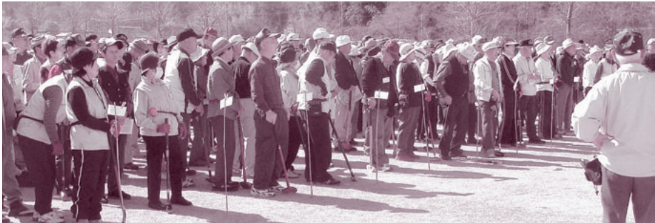
600人以上が参加しての開会式

発行人 都築 靖 発行部数 21,300 編集 「利根の保健」編集委員会 〒378-0053 沼田市東原新町1855番地の1 0278(22)4321 FAX(22)4393 事業所 利根中央病院 (22)4321 利根歯科診療所 (24)9418 老人保健施設とね (22)8855 とね訪問看護ステーション (23)3706 片品村健田 片品診療所 (58)3910