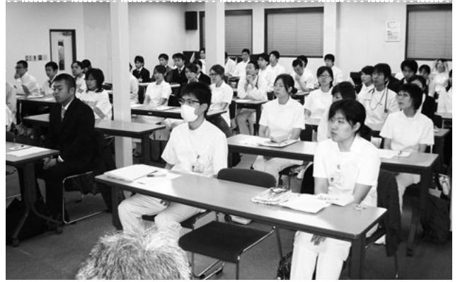
「地域の健康増進に貢献したい」と決意

4月1日、この春から利根保健生協に加わった51人の入協式が行われました。医師13人、研修医4人、看護師16人、医療技術系8人、事務・准看護生10人