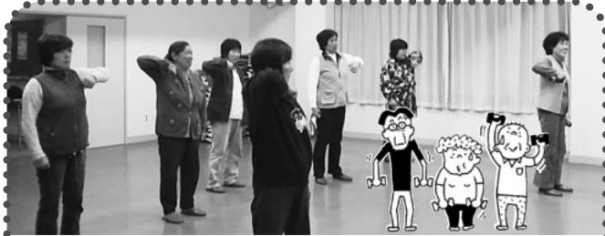
白沢 尾合合同班(ダンベル体操・健康体操) ダンベルを忘れてしまった人も持っているつもりで一緒に体操...