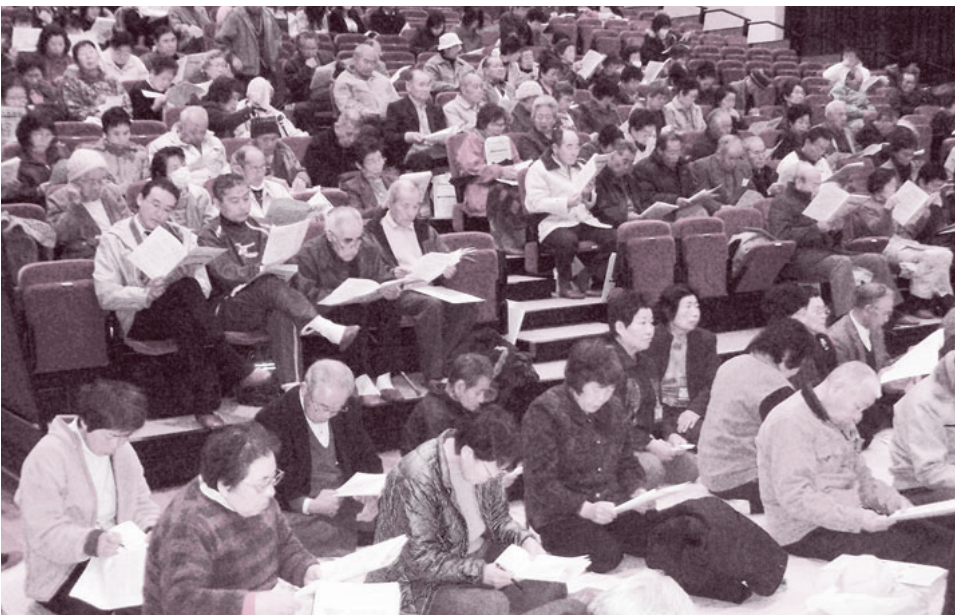
「メタボリック症候群」の話熱心にきく参加者の皆さん

発行人 都築 靖 発行部数 22,000 編集 「利根の保健」編集委員会 〒378-0053 沼田市東原新町1855番地の1 0278(22)4321 FAX(22)4393 事業所 利根中央病院 (22)4321 利根歯科診療所 (24)9418 老人保健施設とね (22)8855 とね訪問看護ステーション (23)3706 片品村健田 片品診療所 (58)3910 印刷 有限会社 コトブキ印刷