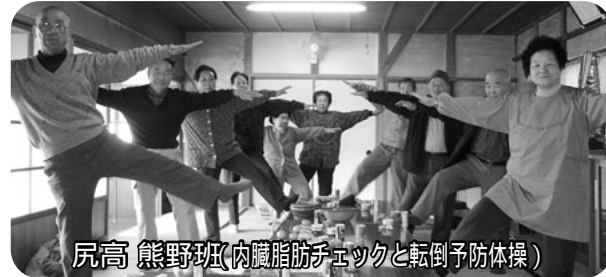
尻高熊野班(内臓脂肪チェックと転倒予防体操)

「歯の保健大学」で「口の中の健康づくり」を学んだ受講者らが、「この知識を近所のみんなに...」と、もつと色んな予防の大切さを知ろうと、「あちこちの班で積極的な健康づくり実習が展開されています。」