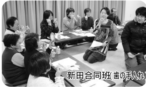
新田合同班(歯の手入れ)