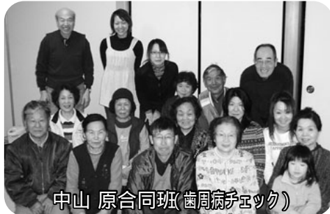
中山原合同班(歯周病チェック)