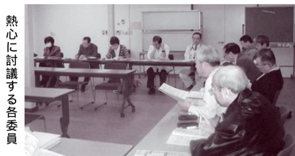
熱心に討議する各委員

会議では、2005年10月の建設準備委員会の設置以降、新病院建設用地の確保、建設委員会や小委員会の立ち上げ以来の取り組み報告、新病院の全体構想や病棟編成な