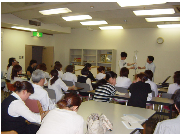
経腸ポンプの学習会の様子

最後に、将来、利根沼田地域の在宅や施設に入所されている患者さんに対しても、開業医の先生方々や他の病院と連携することにより適切な栄養療法を提供していくことをわれわれNSTは理想としています。