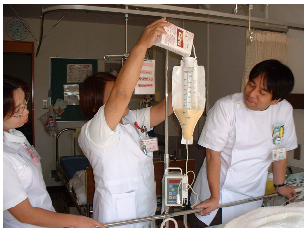
ポンプを使って経腸栄養実施

NST (Nutrition Support Team ; 栄養サポート・チーム) は1970年に米国で始まった、患者さんに適切な栄養管理を行うチームのことです。数年前に日本にも導入され、最近クローズアップされています。当院では平成16年4月より本格的な活動を開始し、現在、県内のNST稼動5施設のひとつとなっています。メンバーは医師、歯科医師、看護師、薬剤師、栄養士、調理師、言語聴覚士、検査技師、MSW、事務職員など約40名のスタッフで構成され、多職種が参加した医療チームとして栄養不良患者さんの栄養改善に努めております。日本においては入院患者の約30~50%が栄養不良と言われております。実際、当院でも入院患者さんの約30%が3.0g/dl以下の低アルブミン血症の状態にあります。昔から「病気が良くなれば、また食べることができるようになるよ。」という言葉を目にしますが、はたして本当にこれで良いのでしょうか。病気だからこそ健康人よりも十分な栄養が必要なのではないのでしょうか。実際に栄養不良の患者さんは合併症の発症率が約2~20倍増加すると報告されております。